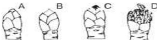
Estádios de desenvolvimento de gemas, em macieiras